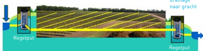
Figuur 2. Drainagesysteem

Bij subirrigatie wordt het water in de bodem gebracht via het bestaande drainagesysteem. De waterhoogte wordt geregeld via regelputten.