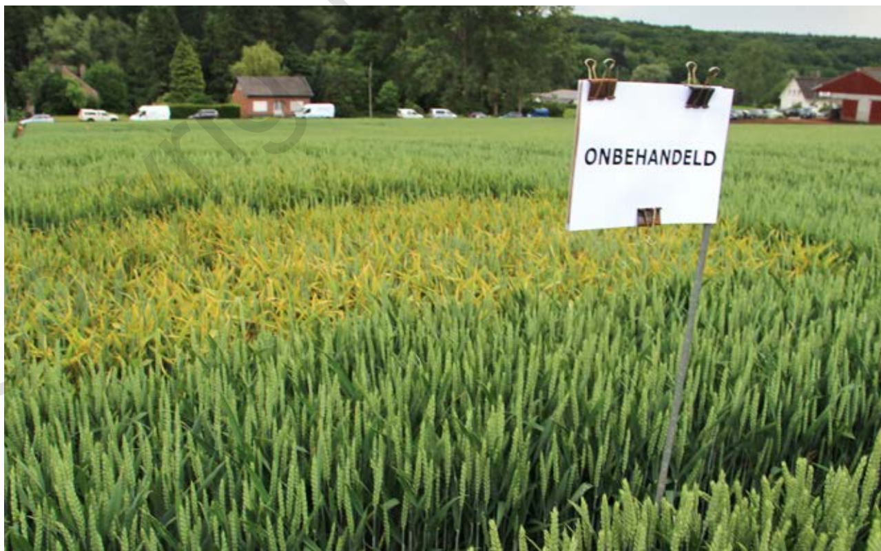
In de onbehandelde strook viel een enkel tarweras door de mand wegens gele roest.

Jean-Luc Lamont van het departement Landbouw en Visserij bracht duiding bij de rassenproef voor wintergerst van het LCV. Bij de 22 rassen in de proef tellen we 7 hybriden en in totaal 8 nieuwe rassen. Lamont ziet het belang van wintergerst jaar na jaar licht toenemen. Hij schrijft dat toe aan een lagere kostprijs