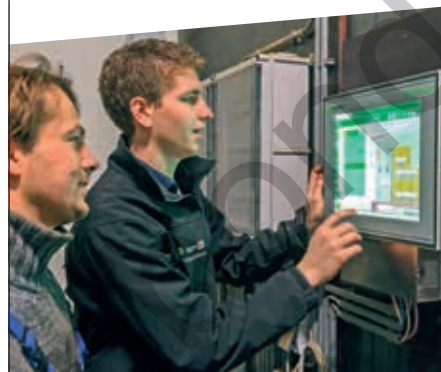
Vision Control klimaatcomputer