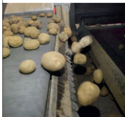
Stenen- en kluitenscheiders