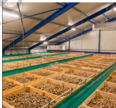
Kistenbewaring met airbagsysteem