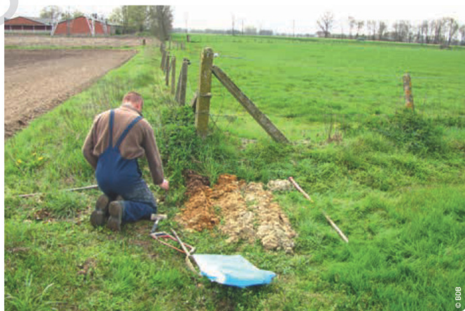
Vorbereiding voor bemonstering van het grondwater in een peilbuis.

Water in de bodem betekent plantengroei. Dikwijls beperkt droogte de productie,